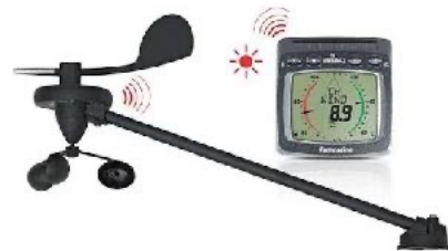
Kabellose solarbetriebene Windmessanlage von Raymarine