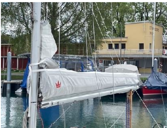
Grossegel mit ZipPack/Lazy Jacks von Elvström Sails