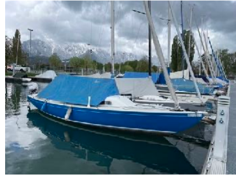
Boot mit Sommerpersenning