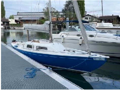
Boot segelfertig April 2024